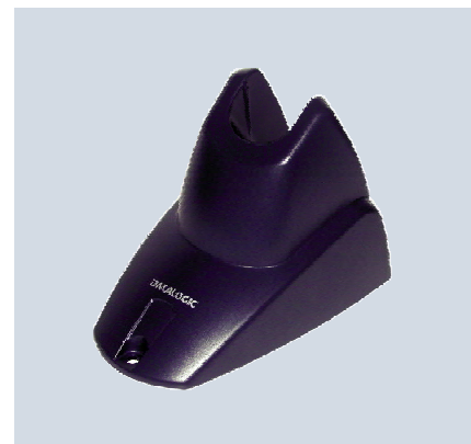
STD Heron™, Ständer für den Freihandbetrieb, optional erhältlich mit Metallplatte